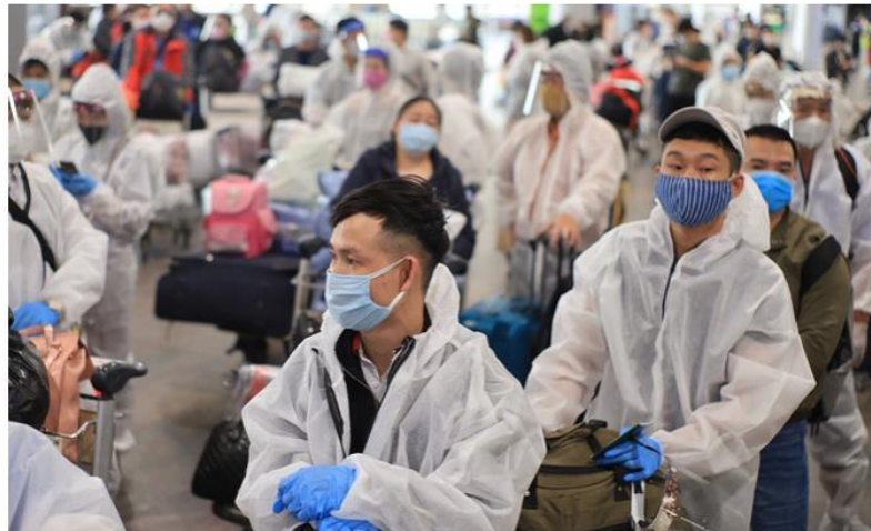
Vietnamese wait to be repatriated home at an airport in Russia, May 12, 2020.

A woman on a repatriation flight from Russia was confirmed Vietnam's latest Covid-19 case Sunday morning, taking the active cases tally to 58.